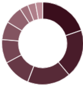
Top 10 Positionen