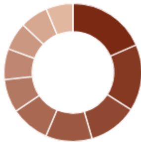
Top 10 Positionen